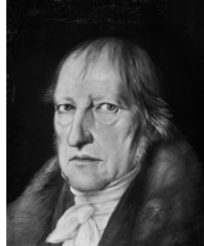
Georg Wilhelm Friedrich Hegel

„Der Mensch wird notwendig anerkannt und ist notwendig anerkennend. [...] Das Anerkanntsein ist unmittelbare Wirklichkeit.“ Anerkannt wird die Gleichheit in der Verschiedenheit.