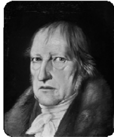
Georg Wilhelm Friedrich Hegel

„Der Mensch wird notwendig anerkannt und ist notwendig anerkennend. [...] Das Anerkanntsein ist unmittelbare Wirklichkeit.“